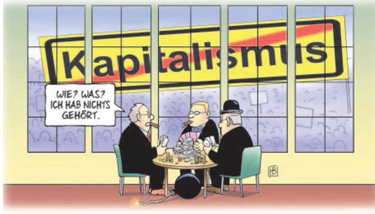
Zeichnung: Harm Bengen