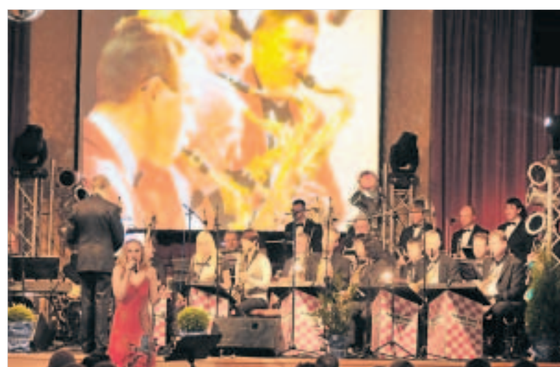
Die Small Town Big Band Döbeln schenkte ihren Fans zum 25. Bestehen ein mitreißendes Jubiläumskonzert.